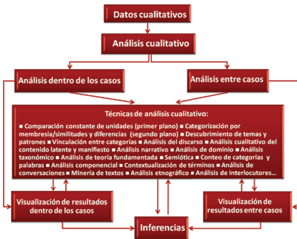
● Figura 13.2 Modelo de las estrategias de análisis cualitativo. 2

Una vez que los datos se encuentran preparados para el análisis (es decir, transcritos y/o en un archivo de imagen, audio o video) y de acuerdo con el planteamiento del problema, el investigador elige si va a efectuar análisis dentro de los casos o entre casos, o bien, ambos (Onwuegbuzie y Combs, 2010; Ayres, Kavanaugh y Knaff, 2003). Los primeros son aquellos en los cuales los datos son analizados caso por caso (uno a la vez). Los segundos involucran el análisis simultáneo de datos provenientes de múltiples casos (al menos dos).